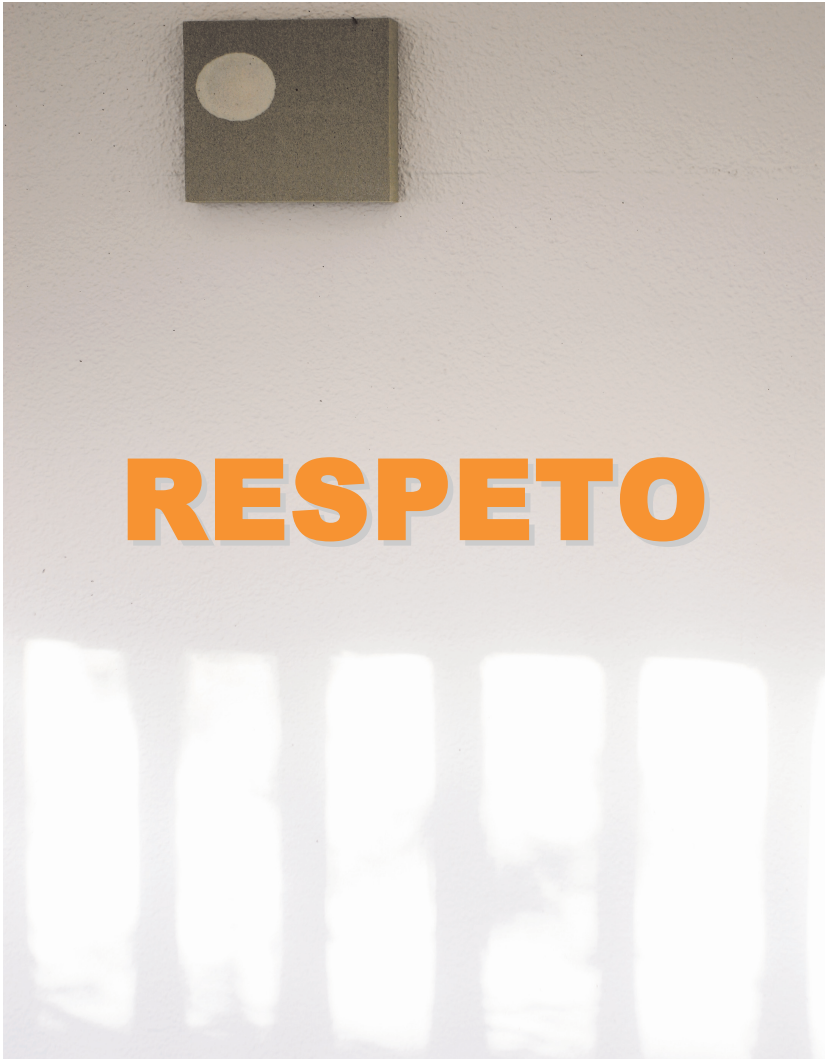
Fotografía: muestra de la obra de Moraza "Símbolos para el Respeto"