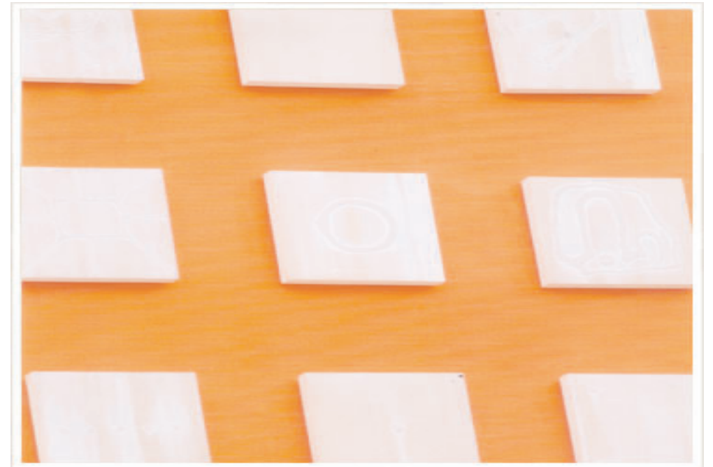
Fotografía: Cuadro de J. M. Moraza en el C. P. Martutene (San Sebastián)

MÓDULOS PENITENCIARIOS PARA LA MEJORA DE LA CONVIVENCIA