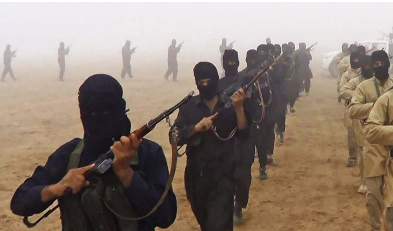
Fig. 12. Miembros del Daesh en Siria realizan una demostración de fuerza (25/08/2015).

En Siria la Primavera Árabe y la represión aplicada por el gobierno desembocaron en una guerra civil que enfrentó a los defensores del status quo y los descontentos con el régimen de Damasco, y en la que pronto entraron los grupos yihadistas. Primero fue Al Qaeda, que constituyó una filial bautizada como Frente al Nusra en 2011. Los primeros combatientes de Al Nusra procedían de Irak, donde operaba una franquicia de Al Qaeda que había ido variando de nombre desde que se organizara para resistir a las tropas de Estados Unidos en 2003. Primero se llamó Organización para el Monoteísmo y la Yihad, luego se bautizó como Al Qaeda en el País de los Dos Ríos; en 2006, pasaron a ser el Estado Islámico de Irak. La decisión del líder de este grupo, Abu Bakr al Bagdadí, de pasar a combatir a Siria, donde ya operaba el Frente Al Nusra, en contra de la opinión de la dirección de Al Qaeda, provocó la ruptura entre las dos organizaciones. El grupo de Al Bagdadí, que había integrado en sus filas a numerosos militares del ejército de Sadam Hussein, se reconvirtió en el Estado Islámico de Irak y Levante (Daesh) a partir de 2013 y luego abrevió a Estado Islámico. Los éxitos