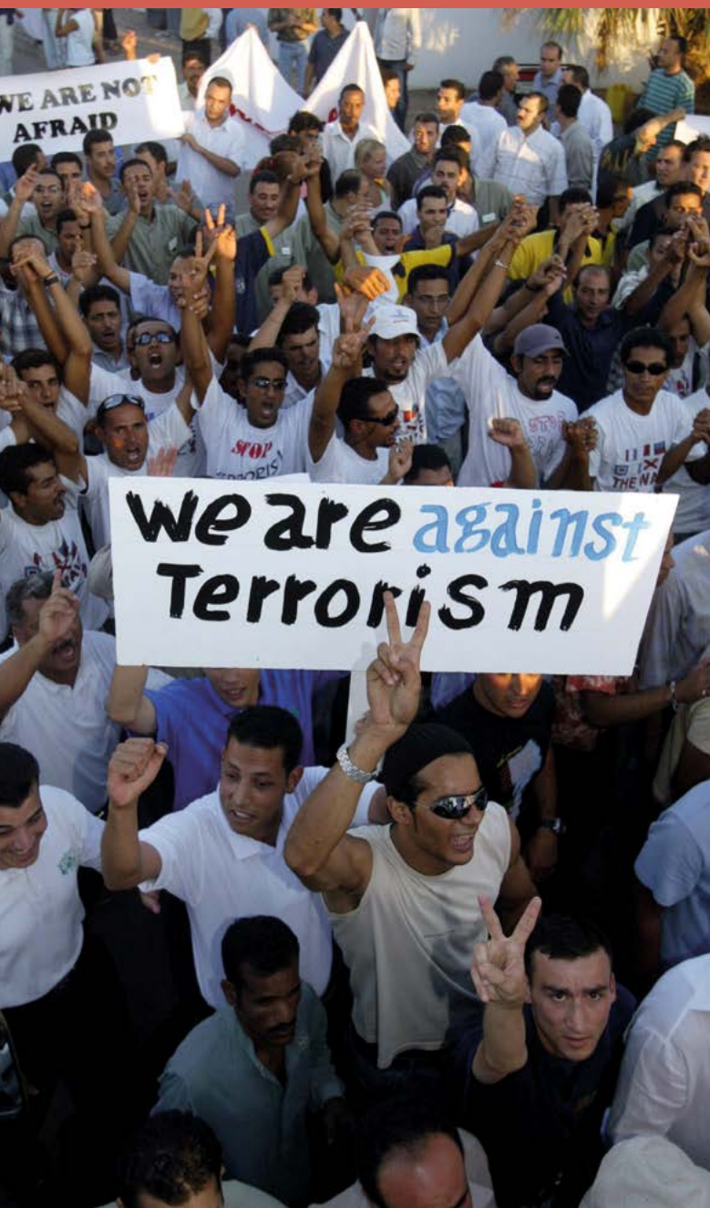
Fig. 13. Cientos de trabajadores se manifiestan a las puertas del Hotel Ghazala Gardens en Sharm el Sheij, Egipto, protestando contra el terrorismo un día después de la serie de ataques con bomba en este complejo turístico que mató al menos a 90 personas e hirió a más de 150 (24/07/2005).

A partir del caso de Tomás Fraga, generar debate e intercambio de opiniones en la clase sobre los efectos del terrorismo y el odio que debió inculcarse a quien fue capaz de cometer tal acción, amparado en la excusa de la supuesta liberación de su pueblo y de su fe. Contraponemos de esta forma el odio que alimenta todo terrorismo frente a la renuncia que hacen las víctimas a tomar venganza y confiar en la impartición de una justicia con todas las garantías. En definitiva, ahí reside la capacidad de resistencia de las democracias que la acción terrorista trata de combatir.