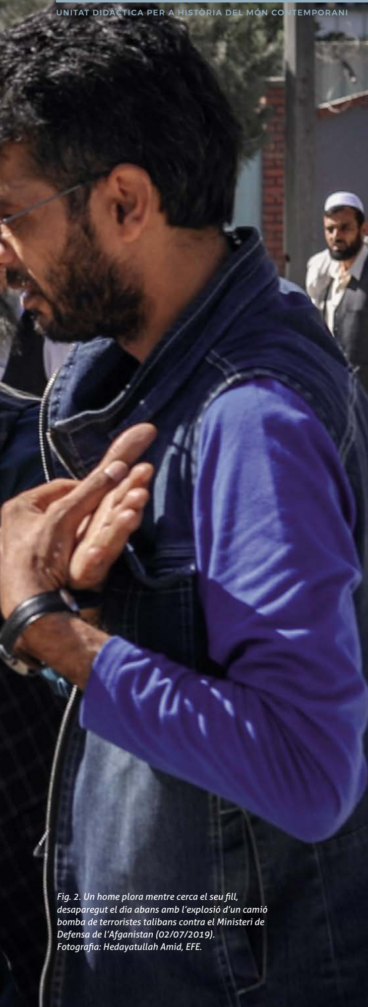
Fig. 2. Un home plora mentre cerca el seu fill, desaparegut el dia abans amb l'explosió d'un camió bomba de terroristes talibans contra el Ministeri de Defensa de l'Afganistan (02/07/2019).