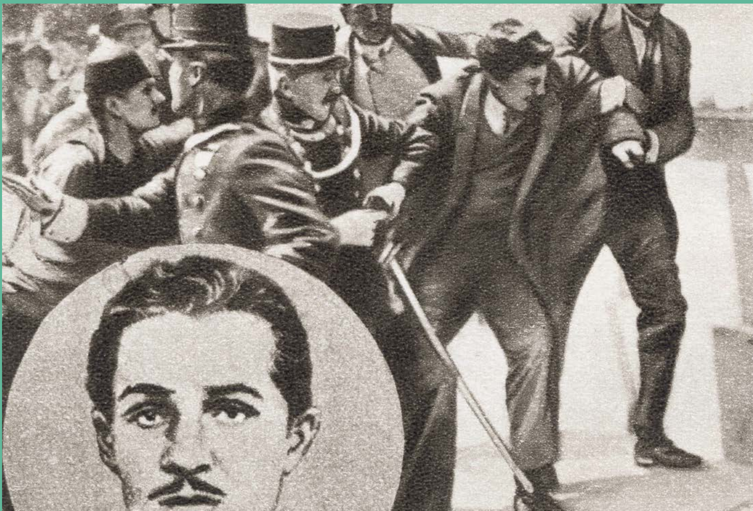
Fig. 7. La policia arresta Gavriilo Princip, assassí de l'arxiduc Francesc Ferran d'Àustria.

FASE B. Un cop acabat el treball per grups, el professor ha de demanar a un portaveu de cada grup que comenti i presenti a la classe el resultat del seu treball. La presentació, oral, es pot acompanyar d'altres suports: pissarra, pissarra digital, murals, vídeos... Les presentacions poden ser gravades per tal que siguin accessibles per a tot l'alumnat a la plataforma o bloc de l'aula. Després de l'exposició de tots els portaveus, el professor fa un recordatori del que s'ha tractat en la introducció de l'activitat i com les diferents versions del terrorisme han sembrat el terror com a eina política, basant-se en el discurs de l'odi i el pensament fanàtic. Finalment, convindria estimular un debat entre l'alumnat, que també es pot gravar i, posteriorment, penjar en la mateixa plataforma.