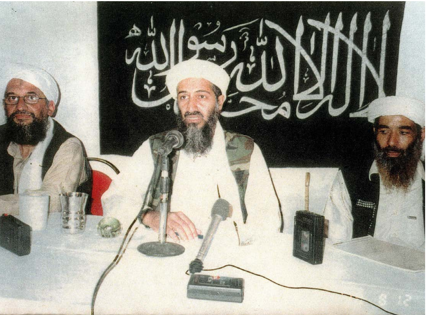
Fig. 9. El saudita Ossama Bin Laden, al centre de la imatge, acompanyat per altres líders d'Al-Qaida: Aiman al-Zawahiri (esquerra) i Mohammed Atef (dreta).

Un dels qui van viatjar a l'Afganistan a combatre va ser Ossama bin Laden, membre d'una opulenta família saudita. El 1988 Bin Laden va crear una organització, batejada com a Al-Qaida (la Base), en la qual es van enquadrar molts combatents experimentats. En el moment fundacional d'aquest grup, amb Bin Laden hi havia Ayman al-Zawahiri, que més endavant va succeir el dirigent saudita al capdavant d'Al-Qaida. El 23 de febrer de 1998, Al-Qaida i altres grups d'inspiració gihadista van crear una aliança que van anomenar Front Islàmic Mundial per a la Gihad contra Jueus i Cristians i que es va convertir en la xarxa terrorista