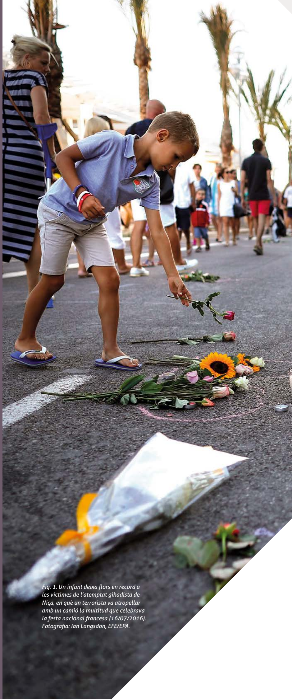
Fig. 1. Un infant deixa flors en record a les víctimes de l'atemptat gihadista de Niça, en què un terrorista va atropellar amb un camió la multitud que celebrava la festa nacional francesa (16/07/2016).

NIPO Ministeri d'Educació i Formació Professional: 847-20-235-7