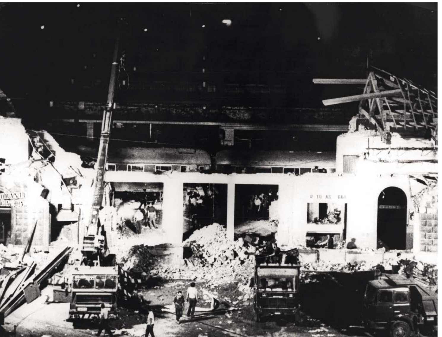
Fig. 3. Vista general de l'estació central de trens de Bolonya, devastada per una explosió terrorista. Fotografia: Keystone Pictures, Zumapress.

Els atemptats originen costos materials i de seguretat.