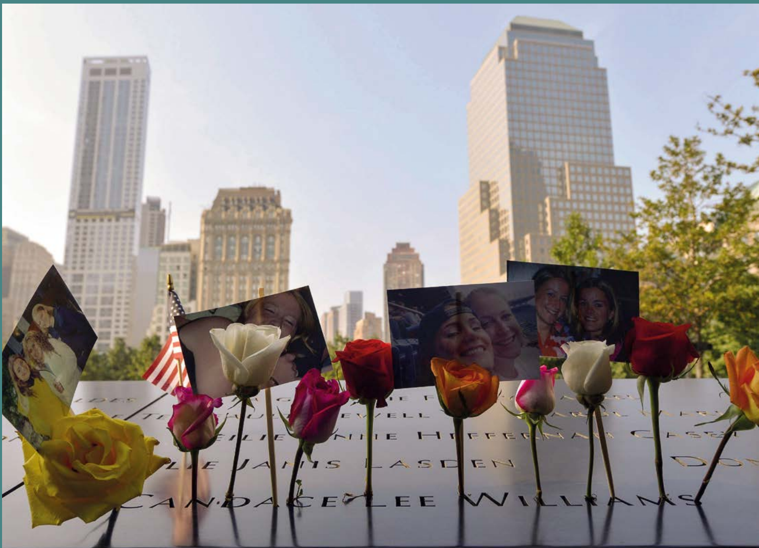
Fig. 10. Flors i fotografies dipositades en honor a les víctimes de l'11-S en un aniversari d'aquests atemptats.

Per acabar l'activitat, cal demanar al grup que manifesti la seva impressió sobre el patiment experimentat per les víctimes d'aquest atemptat. El professor pot dinamitzar el debat introduint preguntes d'aquest tipus: Tot i que els atemptats són diferents, perquè són diferents els contextos sociopolítics i els llocs on es produeixen, consideres que el patiment també és diferent? Són iguals totes les víctimes?