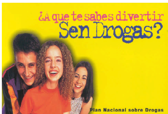
Campaña de la Delegación del Gobierno para el Plan Nacional sobre Drogas «Entérate: Drogas: más información, menos riesgos»