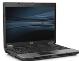
► ORDENADOR PORTÁTIL CON LECTOR DE DNI-E Y MÓDEM GPRS