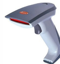
► LECTOR ÓPTICO