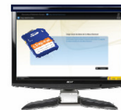
► MONITOR ADICIONAL