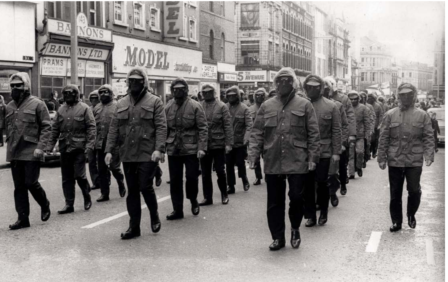
Fig. 4. O ano máis sanguento do terrorismo en Irlanda do Norte foi 1972, cando preto de 500 persoas foron asasinadas, a maioría delas a mans do IRA Provisional.

Estímase que no mundo cada mes se rexistran unha media de 900 atentados, segundo datos do Jane's Terrorism and Insurgency Centre . Reinares (2015) afirma que nove de cada dez atentados a nivel mundial se producen actualmente en Asia meridional, Oriente Medio e a metade setentrional de África. A pesar das súas moitas diferenzas no fondo e na forma, tamén se podería afirmar que grupos aparentemente tan dispares como as FARC, Al Qaida, Daesh, o IRA, ETA ou Boko Haram teñen certas características comúns. Así, en todos eles se presenta un pensamento fanatizado que leva a combater e eliminar o diferente, construído este como un inimigo.