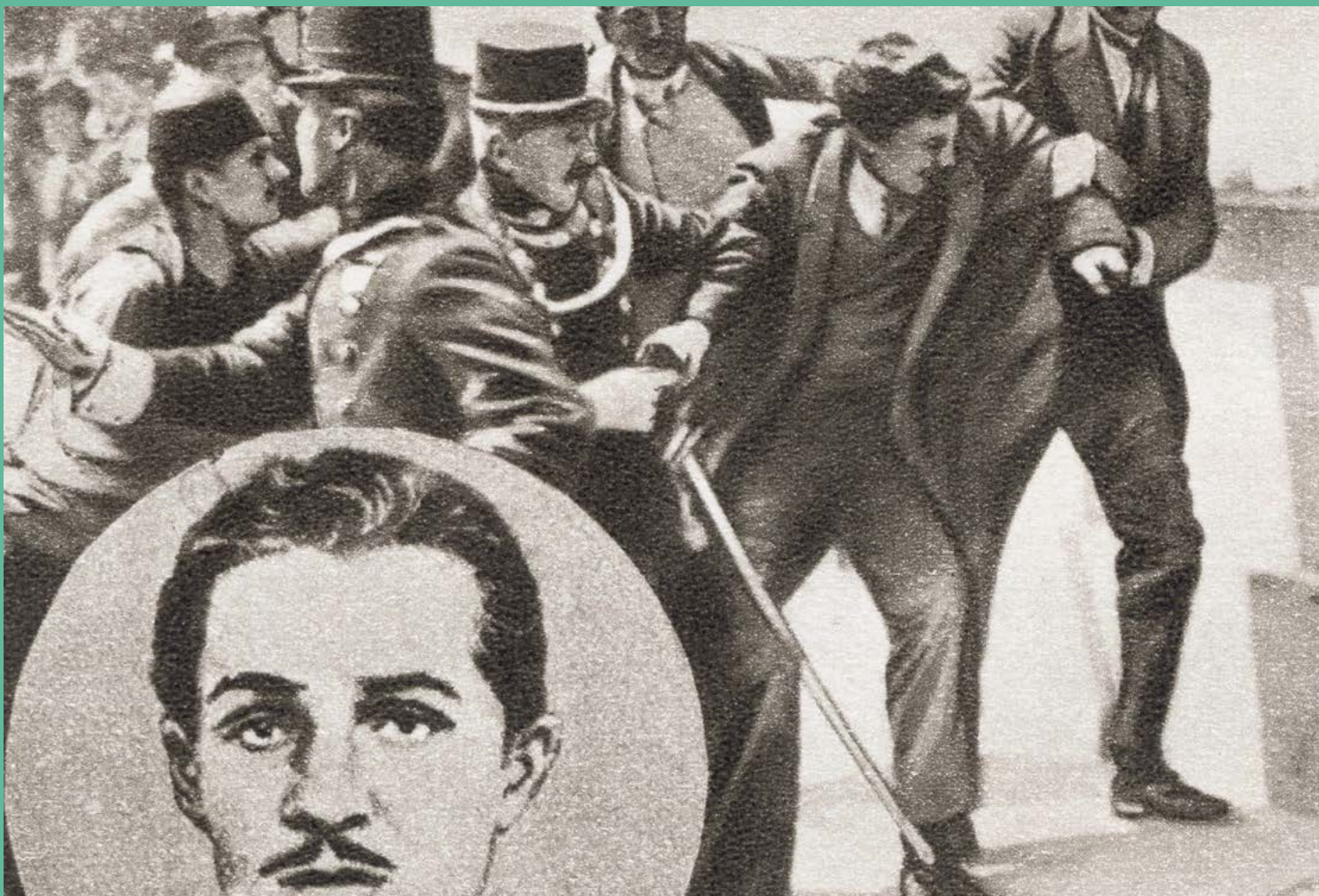
Fig. 7. A policía arresta a Gavrilo Princip, asasino do arquiduque Francisco Fernando de Austria.

FASE B. Unha vez finalizado o traballo por grupos, o profesor pediralle a un portavoz de cada un que comente e lle presente á clase o resultado do seu traballo. A presentación será oral, acompañada, se se desexa, doutros soportes: taboleiro, taboleiro dixital, murais, vídeos... As presentacións poden ser gravadas e quedar así accesibles para todo o alumnado na plataforma ou blog da aula. Finalizada a exposición de todos os portavoces, o profesor lembrará o visto na introdución da actividade e como as distintas versións do terrorismo sementaron o terror como ferramenta política, baseada no discurso do odio e o pensamento fanático. Para finalizar, é desexable que se estimule o debate entre o alumnado, que pode ser tamén gravado e colgado posteriormente na mesma plataforma.