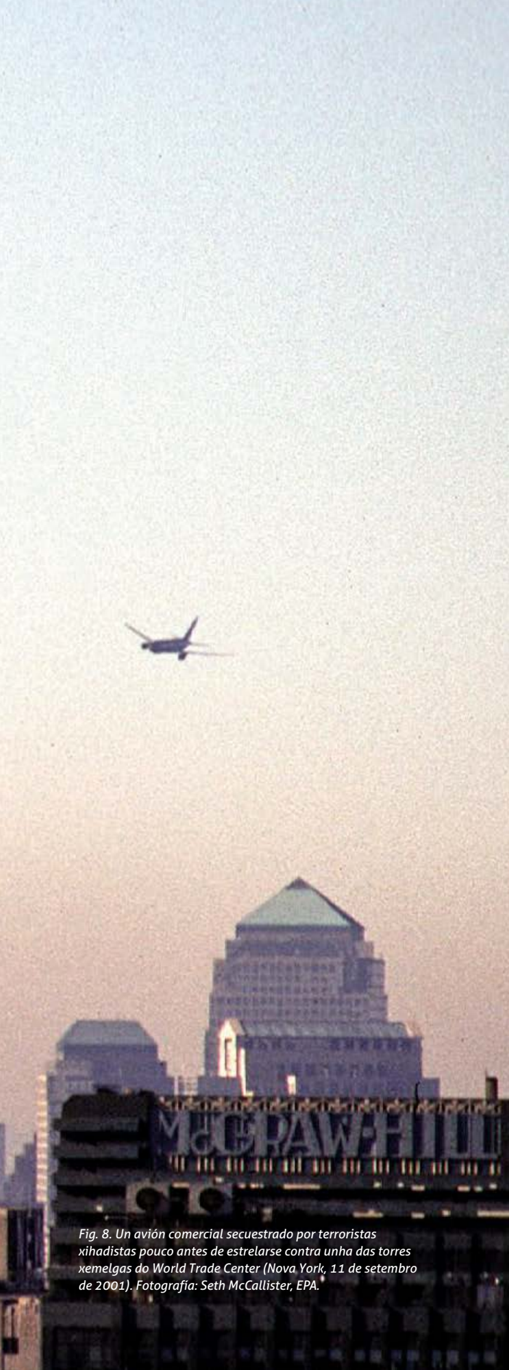
Fig. 8. Un avión comercial secuestrado por terroristas xihadistas pouco antes de estrelarse contra unha das torres xemelgas do World Trade Center (Nova York, 11 de setembro de 2001).