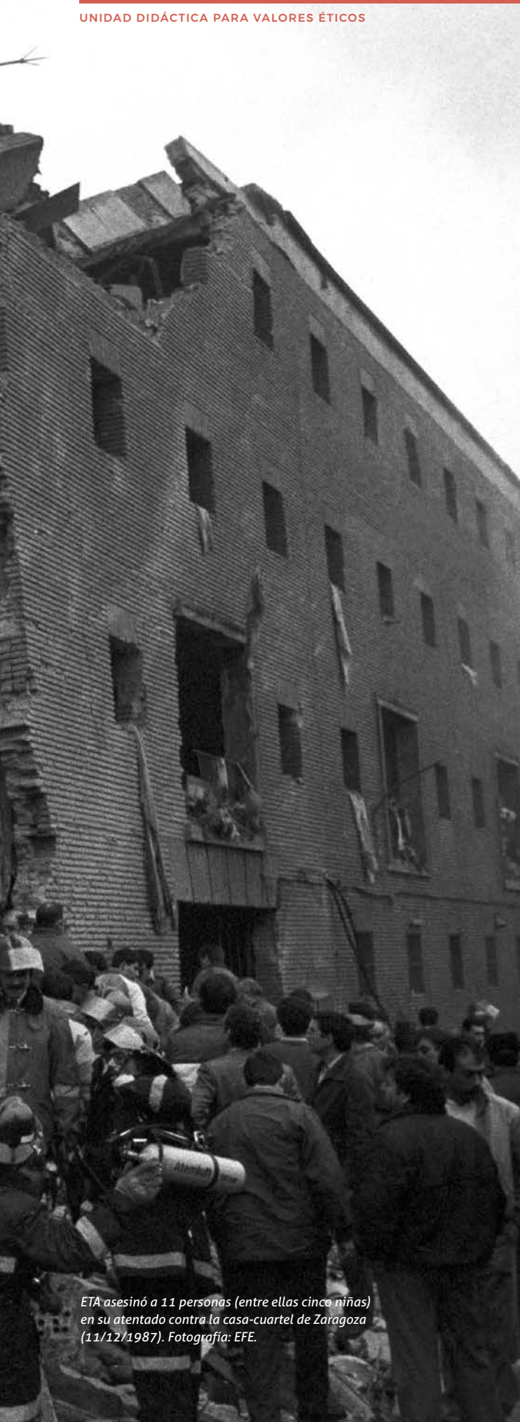
ETA asesinó a 11 personas (entre ellas cinco niñas) en su atentado contra la casa-cuartel de Zaragoza (11/12/1987).