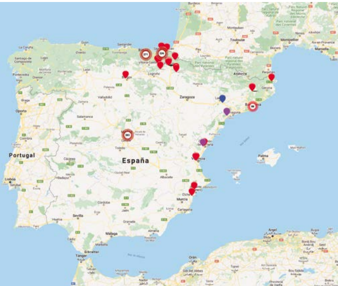
Mapa del terror de Covite: https://mapadelterror.com

Lamentablemente esta vulneración de los derechos humanos ocurre en buena parte del mundo y también muy cerca de ti. Hay un dato estremecedor: solo en España, casi 1500 personas han perdido la vida como consecuencia de actos terroristas desde 1960.