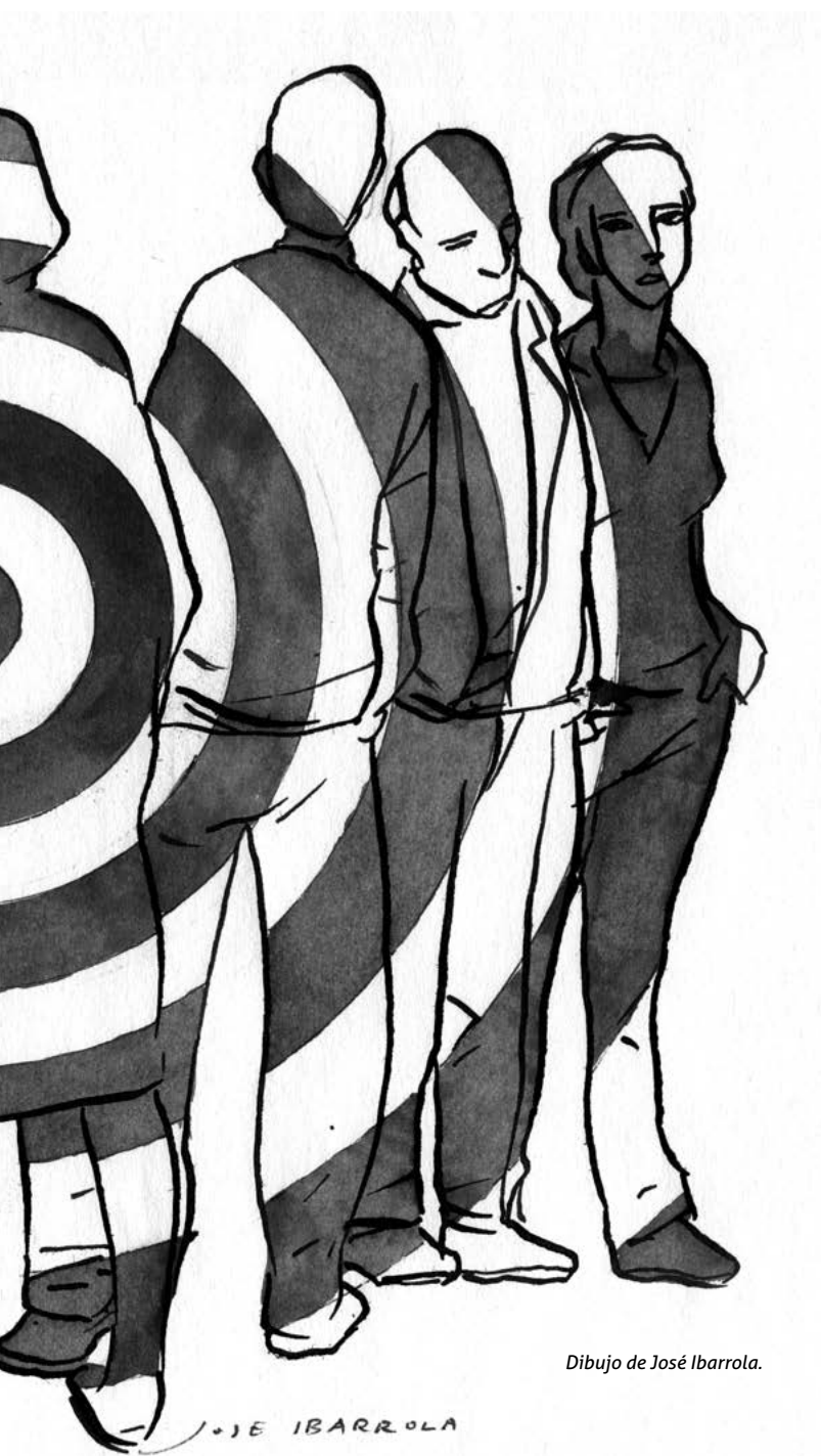
Dibujo de José Ibarrola.

Son muy importantes los conocimientos adquiridos, el análisis de tus emociones y sentimientos, la reflexión acerca de lo que hacemos ante las víctimas de violaciones de derechos humanos (en concreto del terrorismo), así como su petición de memoria, justicia, verdad y reparación.