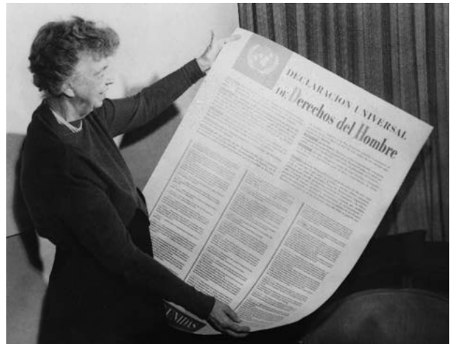
Eleanor Roosevelt con la DUDH en español. Noviembre 1949.