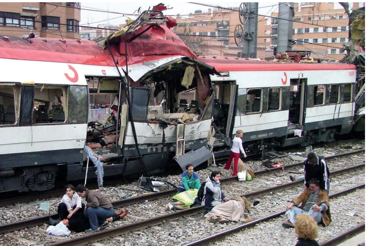
Víctimas del atentado del 11-M de 2004 recibiendo ayuda.