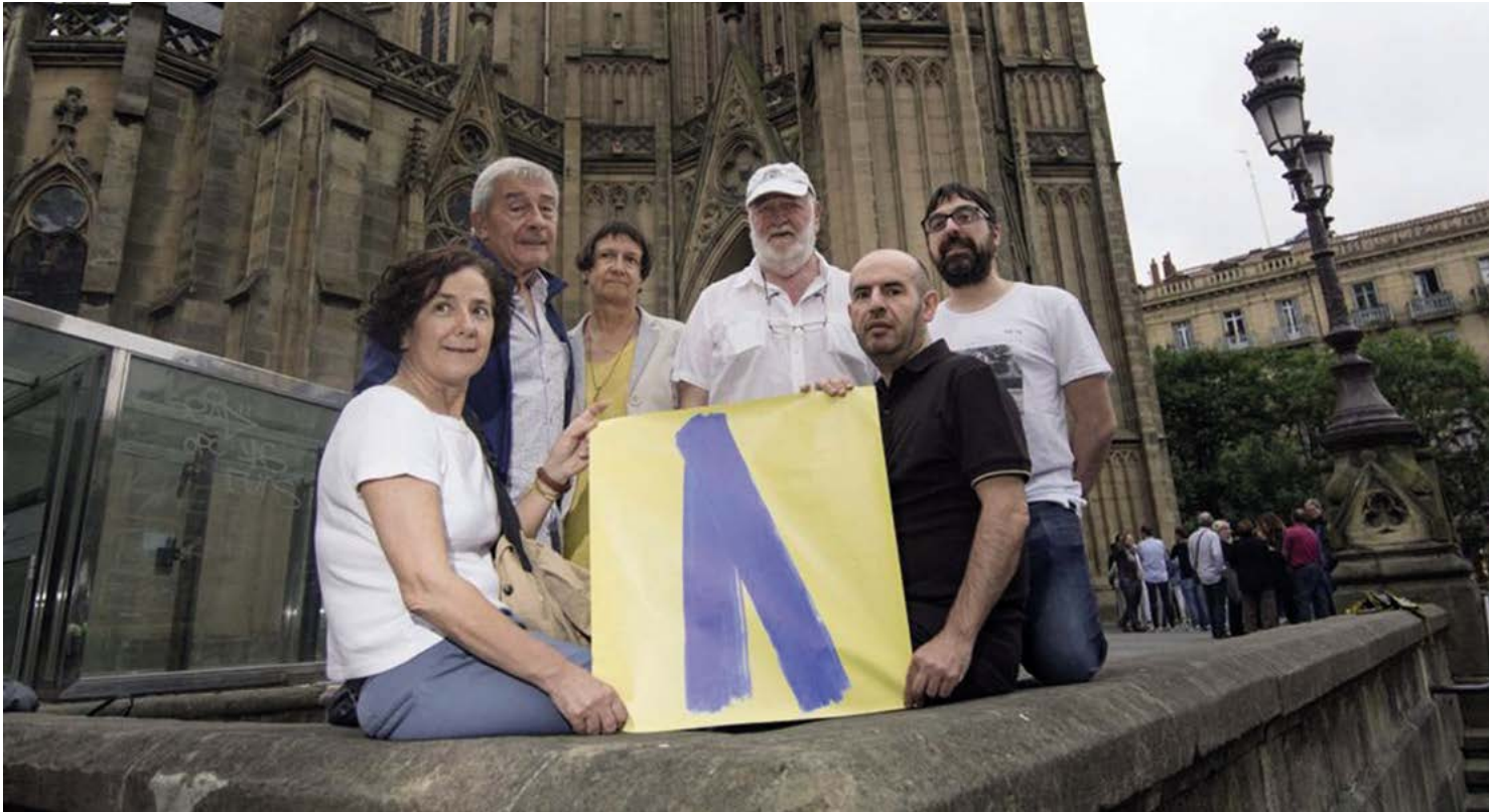
Imagen del reportaje El secuestro que desató el lazo azul .