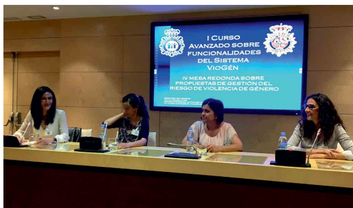
Asistentes al I Curso Avanzado de Funcionalidades del Sistema VioGén, organizado por el Servicio Central de Violencia de Género del Gabinete de Coordinación y Estudios de la Secretaría de Estado de Seguridad, celebrado del 7 al 11 de mayo.