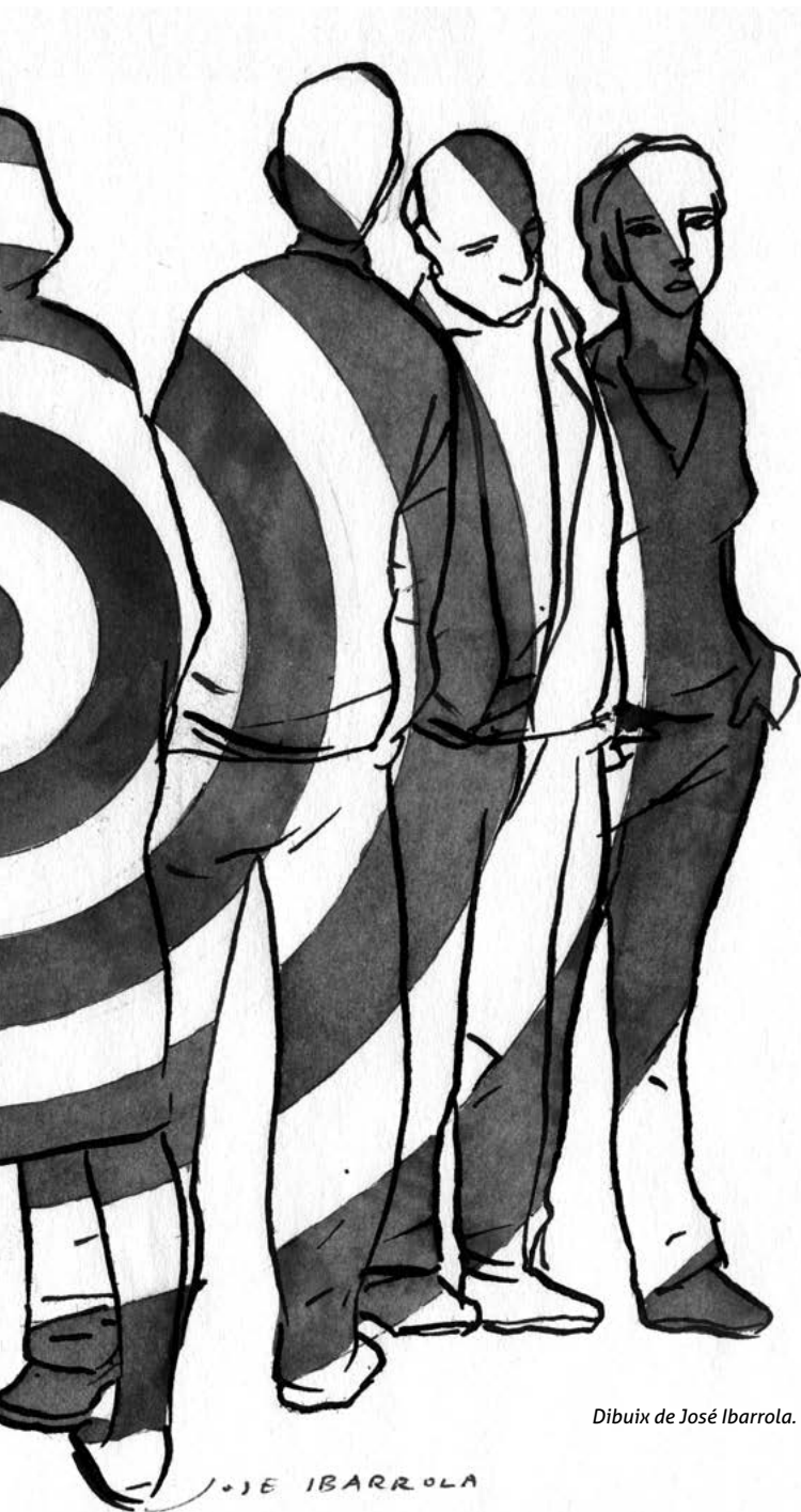
Dibuix de José Ibarrola.

Tenen molta importància els coneixements adquirits, l'anàlisi de les emocions i els sentiments propis, la reflexió sobre el que fem davant les víctimes de violacions de drets humans (en concret, del terrorisme), com també sobre la seva petició de memòria, justícia, veritat i reparació.