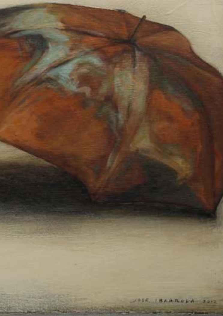
Quedaran en la memòria (2012). Pintura de José Ibarrola.