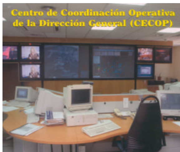
Centro de Coordinación Operativa (CECOP)

La Operación Paso del Estrecho, las diversas actuaciones en los incendios forestales o la colaboración con otros países ante grandes catástrofes constituyen, generalmente, las grandes operaciones que más se conocen de la labor realizada desde la Dirección General de Protección Civil. Este año, además de recordar el trabajo y el éxito con el que se han desarrollado estos trabajos, destacamos: los programas de prevención desarrollados desde la Subdirección General de Planes y Operaciones; el éxito de la Operación Paso del Estrecho, que ha permitido el tránsito de más de 2 millones de personas; la eficacia en los incendios forestales; las ayudas y subvenciones concedidas para afrontar situaciones de emergencia; la labor realizada desde la Escuela Nacional de Protección Civil y, por último, las actividades que han fomentado las relaciones internacionales.