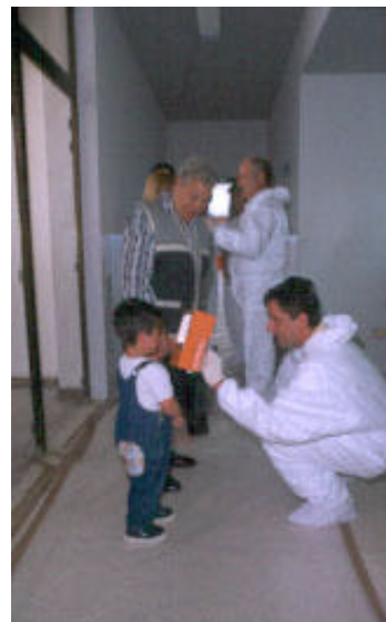
Simulacro nuclear en Garona (Burgos)

La Escuela también ha desarrollado distintas actividades formativas en el ámbito internacional entre las que destaca el Curso Iberoamericano de Capacitación Técnica en Salvamento y Desescombro ante Catástrofes Naturales o las Jornadas Técnicas del Comité de Protección Civil de la OTAN.