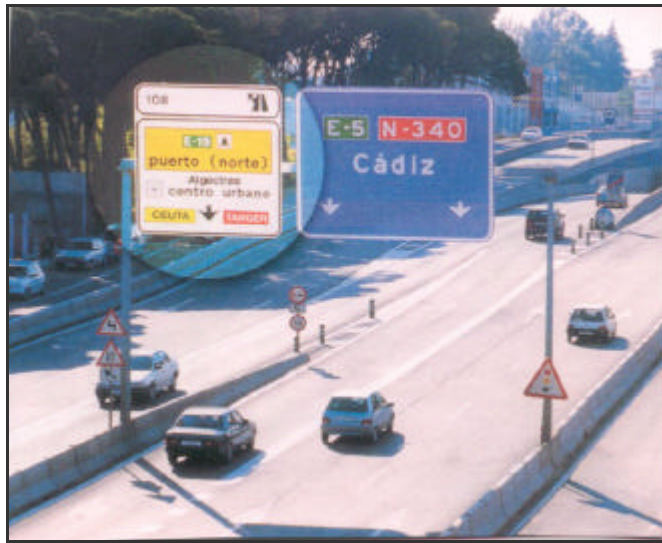
Operación Paso del Estrecho

En su conjunto, y coordinados por la Subdirección General de Planes y Operaciones, han trabajado más de 800 personas y se han realizado inversiones cercanas a los 700 millones de pesetas.