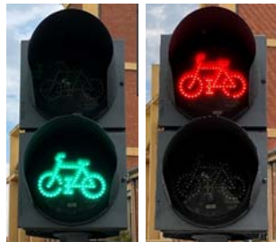
Semáforos para ciclos y ciclomotores

d) Una franja blanca, vertical u oblicua, iluminada intermitentemente, indica que los citados vehículos deben detenerse en las mismas condiciones que si se tratara de una luz amarilla fija