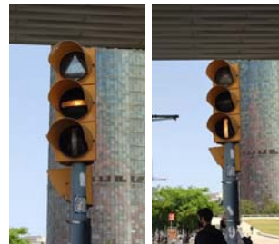
Semáforos reservados para tranvías y autobuses