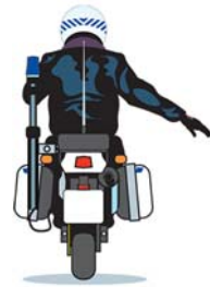
Brazo extendido hacia abajo inclinado y fijo