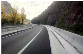
Barrera lateral rígida