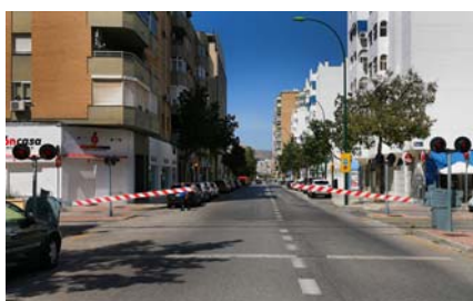
Barrera o semibarrera móvil