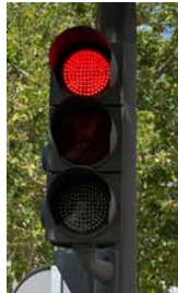
Luz roja no intermitente