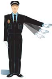
Brazo extendido moviéndolo alternativamente de arriba a abajo