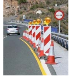
Luces amarillas fijas o intermitentes