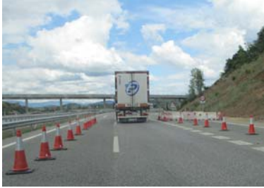
Banderitas, conos o dispositivos análogos