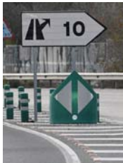
Hitos de vértice