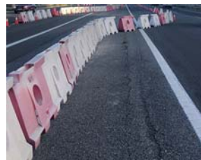
Barrera lateral desplazable