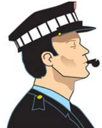
Señales hechas con silbato