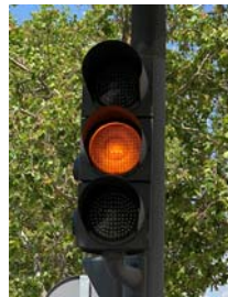
Luz amarilla no intermitente