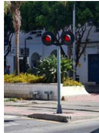
Luz roja intermitente