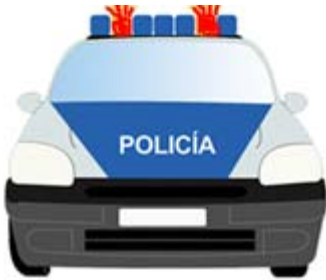
Luz roja intermitente o destellante hacia adelante