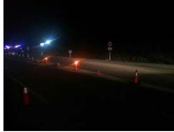
Luz roja fija