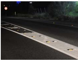
Captafaros horizontales (ojos de gato)