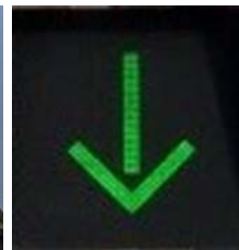
Luz verde en forma de flecha