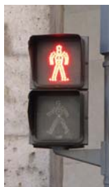
Luz roja no intermitente en forma de peatón inmóvil

b) Una luz verde no intermitente, en forma de peatón en marcha, indica a los peatones que pueden comenzar a atravesar la calzada. Cuando dicha luz pase a intermitente, significa que el tiempo de que aún disponen para terminar de atravesar la calzada está a punto de finalizar y que se va a encender la luz roja.