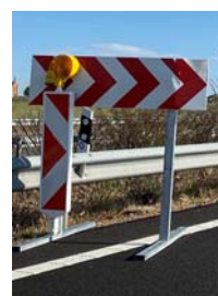
Panel direccional provisional