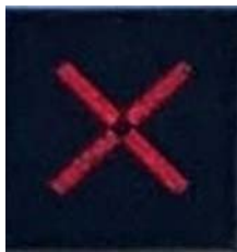
Luz roja en forma de aspa