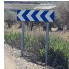
Panel direccional permanente