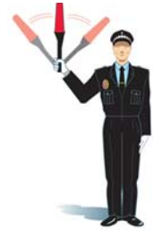
Balanceo de una luz roja o amarilla