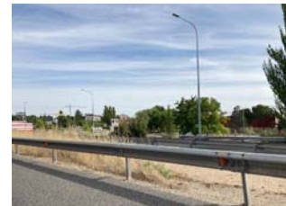
Barrera lateral semirrígida