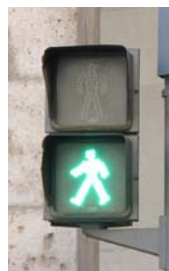
Luz verde no intermitente en forma de peatón en marcha