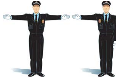
Brazo o brazos extendidos horizontalmente