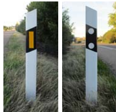
Hitos de arista