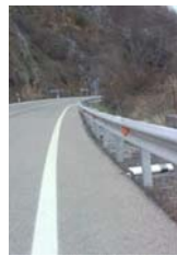
Captafaros de barrera