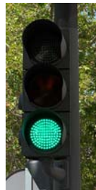
Luz verde no intermitente